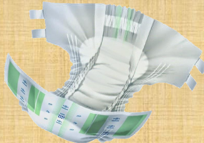
Couche pour adulte

DHT11 : Capteur de température et d'humidité